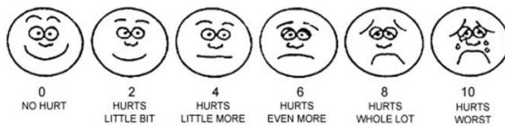
تصویر شماره ۱: صورتک ونگ بیکر

جدول شماره ۳: میانگین درد در اطفال به تفکیک در دو گروه LigaSure و cold dissection بر اساس ابزار ونگ بیکر